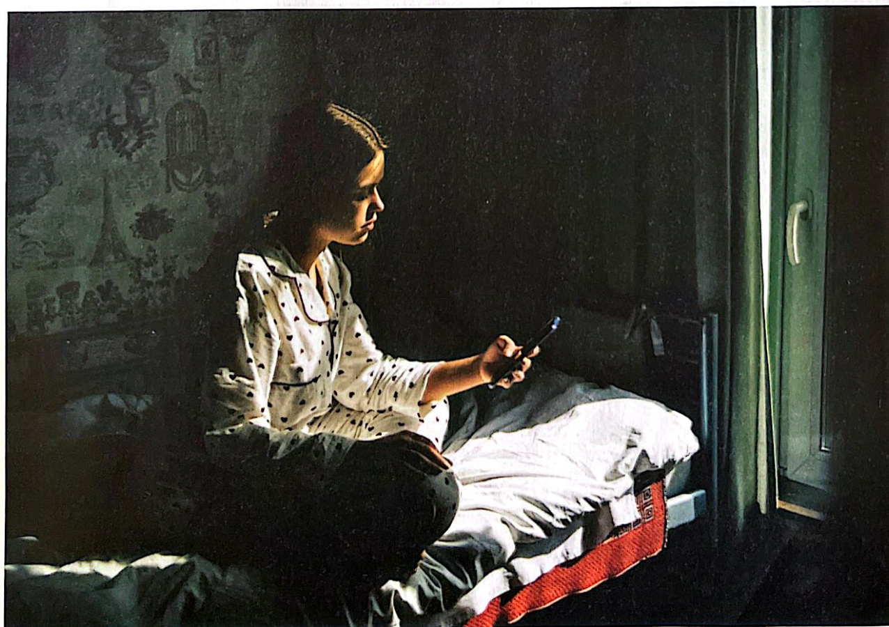
Una teenager nella solitudine della sua stanza alle prese con il cellulare, unico tramite con l'esterno.